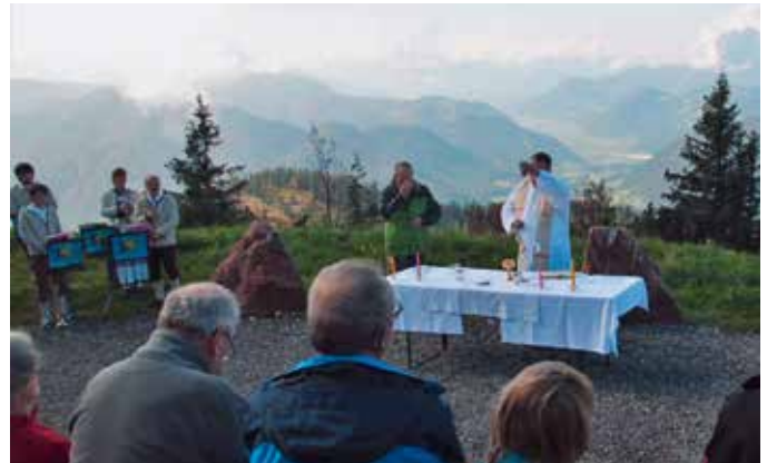
Das Foto entstand bei der Bergmesse 2014 auf der Steinplatte.

Ein weiteres Ereignis, bei dem Frau Corona-Covid noch ein Wörtchen mitzureden hat, ist das 60-jährige Bestehen des