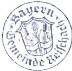
Vilsmaier, 1. Bürgermeister